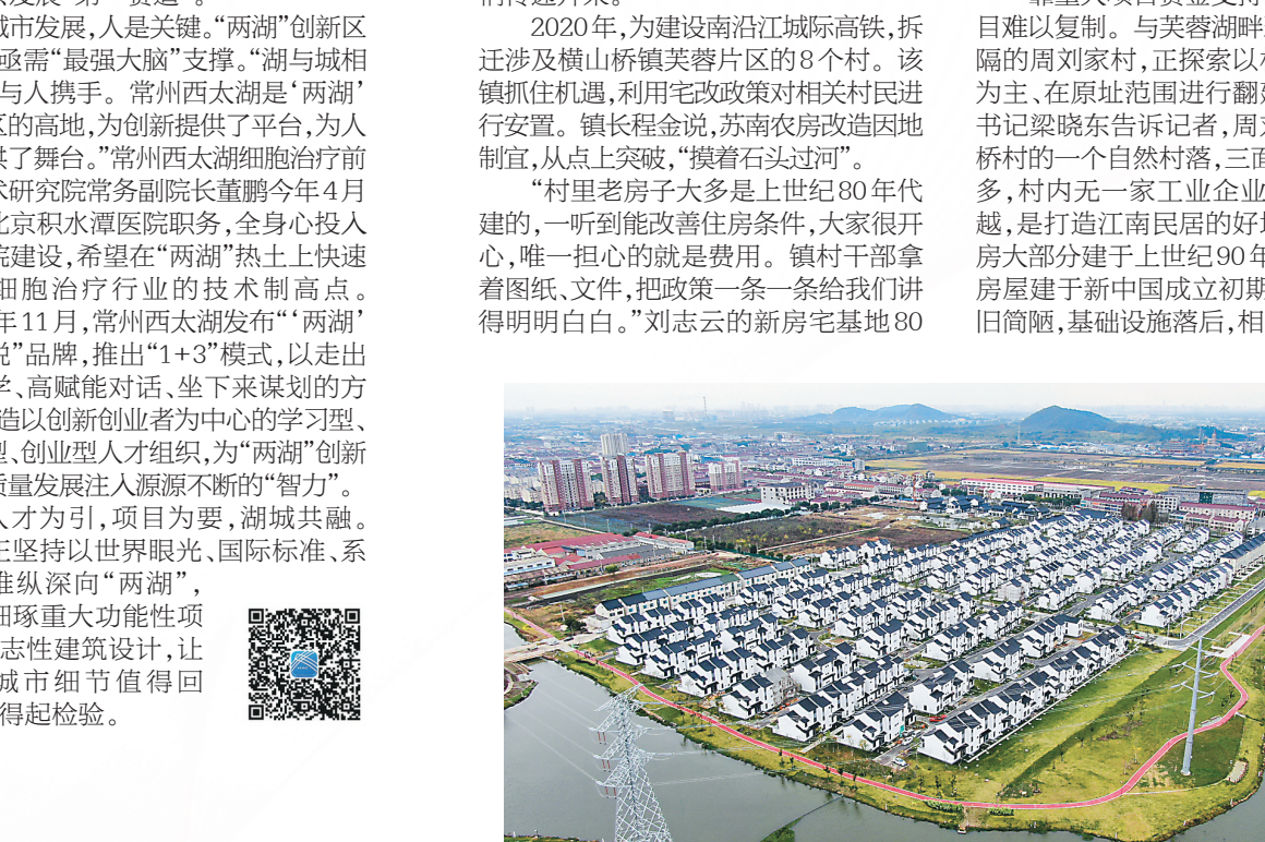
横山桥镇芙蓉湖畔雅苑新民居

□ 本报记者 范玉霞 常州经开区横山桥镇261套连片的新农居——芙蓉湖畔雅苑,白墙灰瓦的中式韵味雅致。农家村民刘立志云拿着设计图纸,和施工团队讨论加快推进新房装修进度。“明年前装修好搬进新房呢。”谈话间,幸福从他的眼角眉梢传递开来。 “村里老房子大多是上世纪80年代建的,一听到能改善住房条件,大家很开心。镇长晓东告诉我,周刘家村是农家桥村的一个自然村,三面环水,河滩众多,村内无一家工业企业,自然禀赋优越,是打造江南民居的好地方。村内外大部分建于上世纪90年代以后,部分房屋建于新中国成立初期甚至更早,破旧简陋,基础设施落后,相当一部分还存