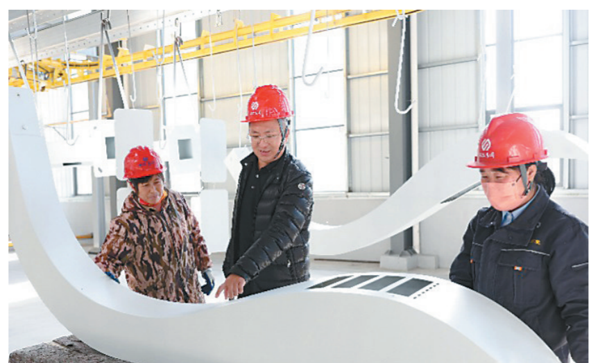
高邮送桥镇诺尔集团负责人在车间指导生产。