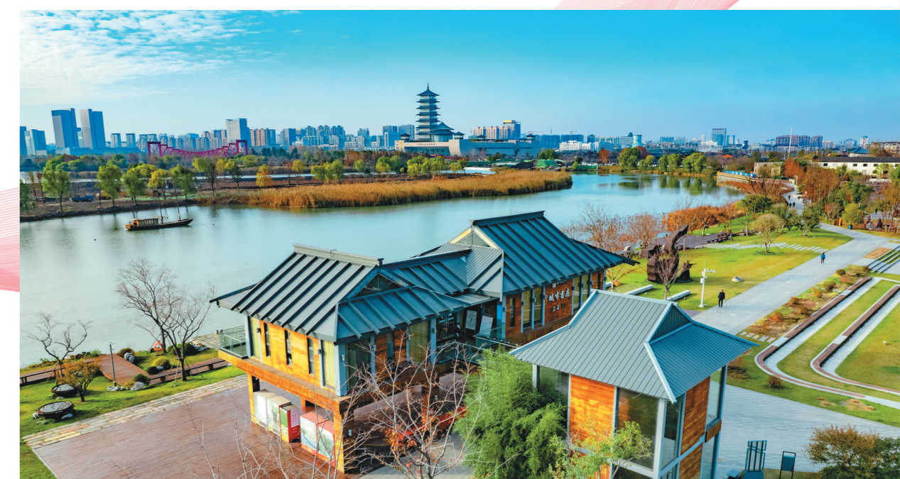
扬州三湾城市书房。