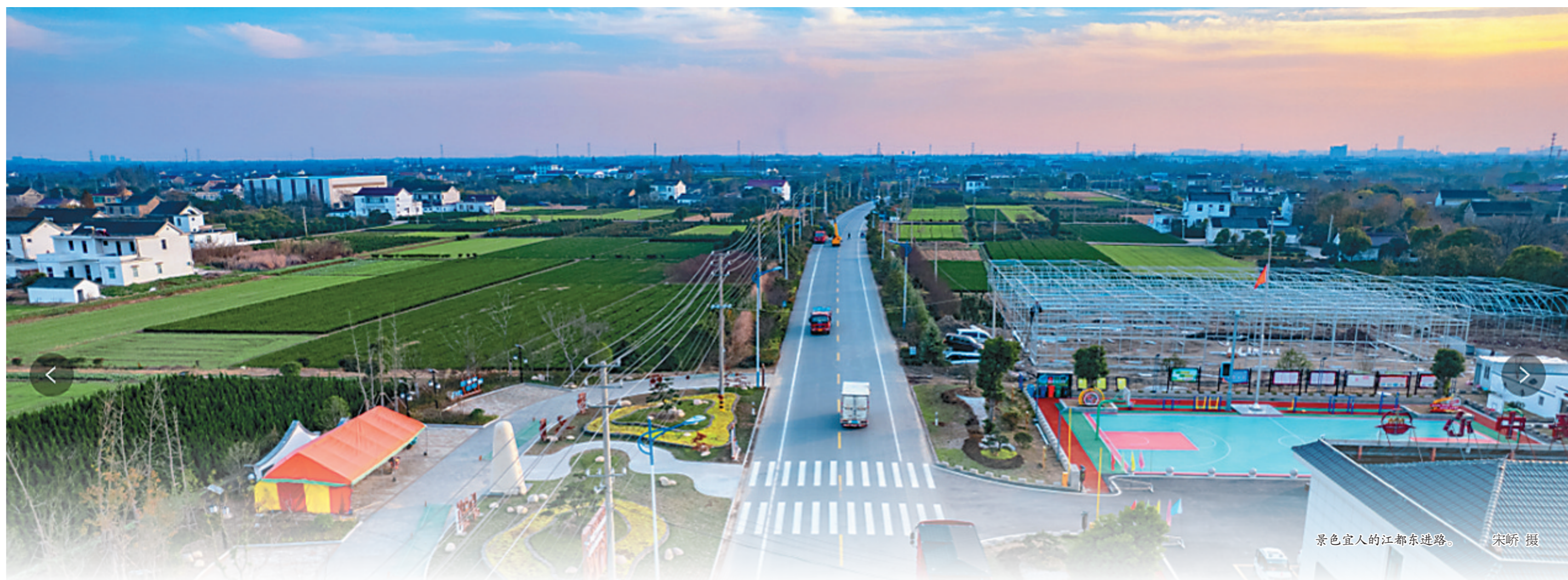
景色宜人的江都东进路。

张宝娟:我们将坚持把实现人民对美好生活的向往作为现代化建设的出发点和落脚点,努力让人民群众不仅物质富足而且精神富有。围绕“有更好的教育”,推进学前教育普惠发展、义务教育优质均衡发展、高中教育高质量发展在全省第一方阵。加快东南大学医学院转设和江苏戏剧学院建设。围绕“有更稳定的工作”,推进创业带动就业,着力打造高质量就业示范城市。围绕“有更满意的收入”,健全工资合理增长机制,确保低收入群体收入增长速度快于经济增长,高于省均水平。围绕“有更可靠的社会保障”,健全覆盖全民、统筹城乡、公平统一、可持续发展的多层次社会保障体系,确保共同富裕路上一个不掉队。围绕“有更高质量的医疗卫生服务”,加快推进紧密型医联体、县域医共体建设,着力打通上下联动、防治结合的公共卫生体系。围绕“有更舒适的居住条件”,建立完善多主体供给、多渠道保障、租购并举的住房制度,高标准推进老旧小区、城中村、棚户区(危旧房)改造,让扬州人民的居住条件一年更比一年好。围绕“有更优美的环境”,着力建设在园中、园在城中的公园城市。围绕“有更丰富的精神文化生活”,推动城乡基层文化设施资源均衡配置,加快建设城乡“十分钟文化生活圈”。