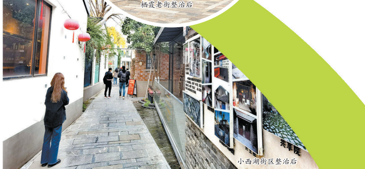
小西湖街区整治后