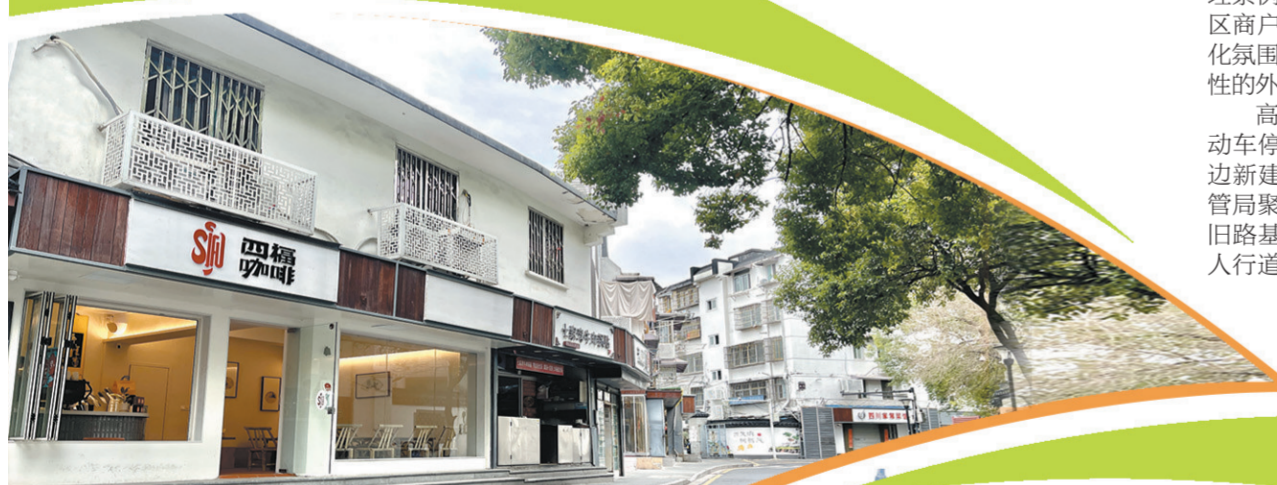
大四福巷(建康路—瞻园路)整治后

小街巷连着大民生。焕然一新的小巷里，烟火气在流动，历史在传承，文明在升华，正承载着人们热气腾腾的市井生活。