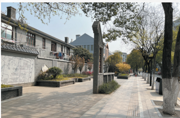
梅园新村路整治后

当下，垃圾分类新时尚正融入人们生活。雨花台区在整治和路时，将其打造成了一条凸显垃圾分类特色的精品街巷。道路两侧的居民小区围墙栏杆上有垃圾分类宣传语，道路两侧的灌木丛中立着一个个垃圾分类标语特色标牌，让居民充分了解垃圾分类的相关知识。