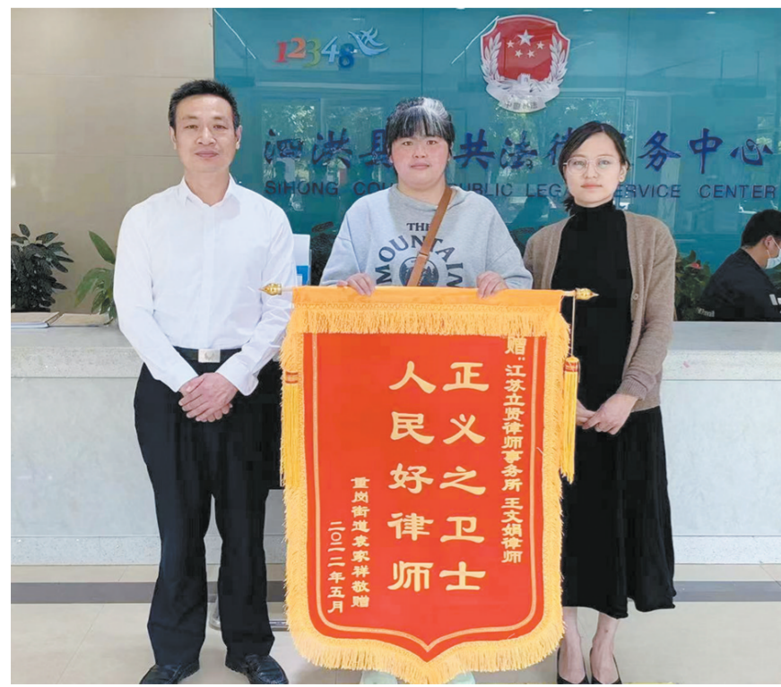
受援人廖某某向办案律师赠送锦旗

庭审结束后,等在庭外的孩子与父亲第一次见了面。钱某征求了孩子的意见,希望暑假能抽出时间一起度过,孩子表示认可,生疏十年的父子关系得以缓和。 宋振涛