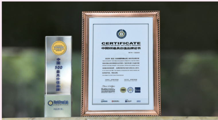
中国500最具价值品牌证书