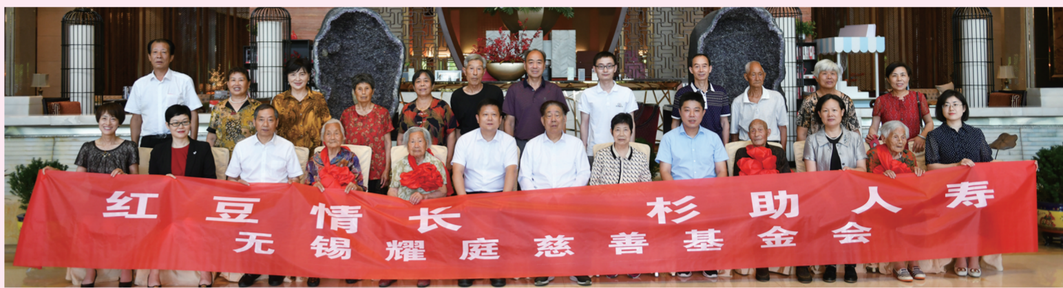
关爱百岁老人活动