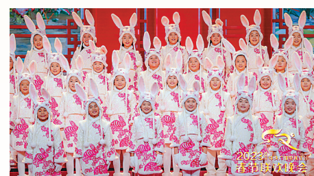
马兰花童声合唱团彩排中。