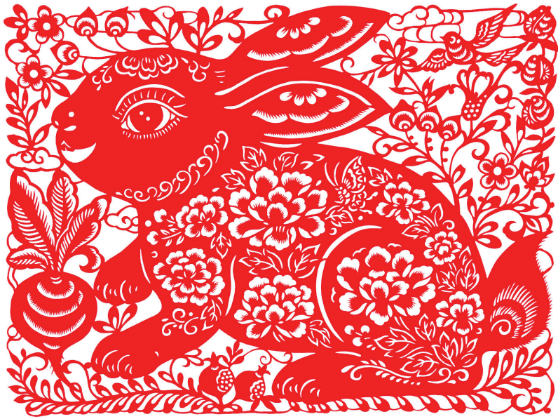
《玉兔迎春》剪纸 陈耀

不妨欣赏下“范苏州”对苏州的花式表白——“走在今天的平江路上，仍然能够感受到昨天的平江路的脉搏是怎样地跳动着。我们一边觉得难以置信，一边就怦然心动起来了……”