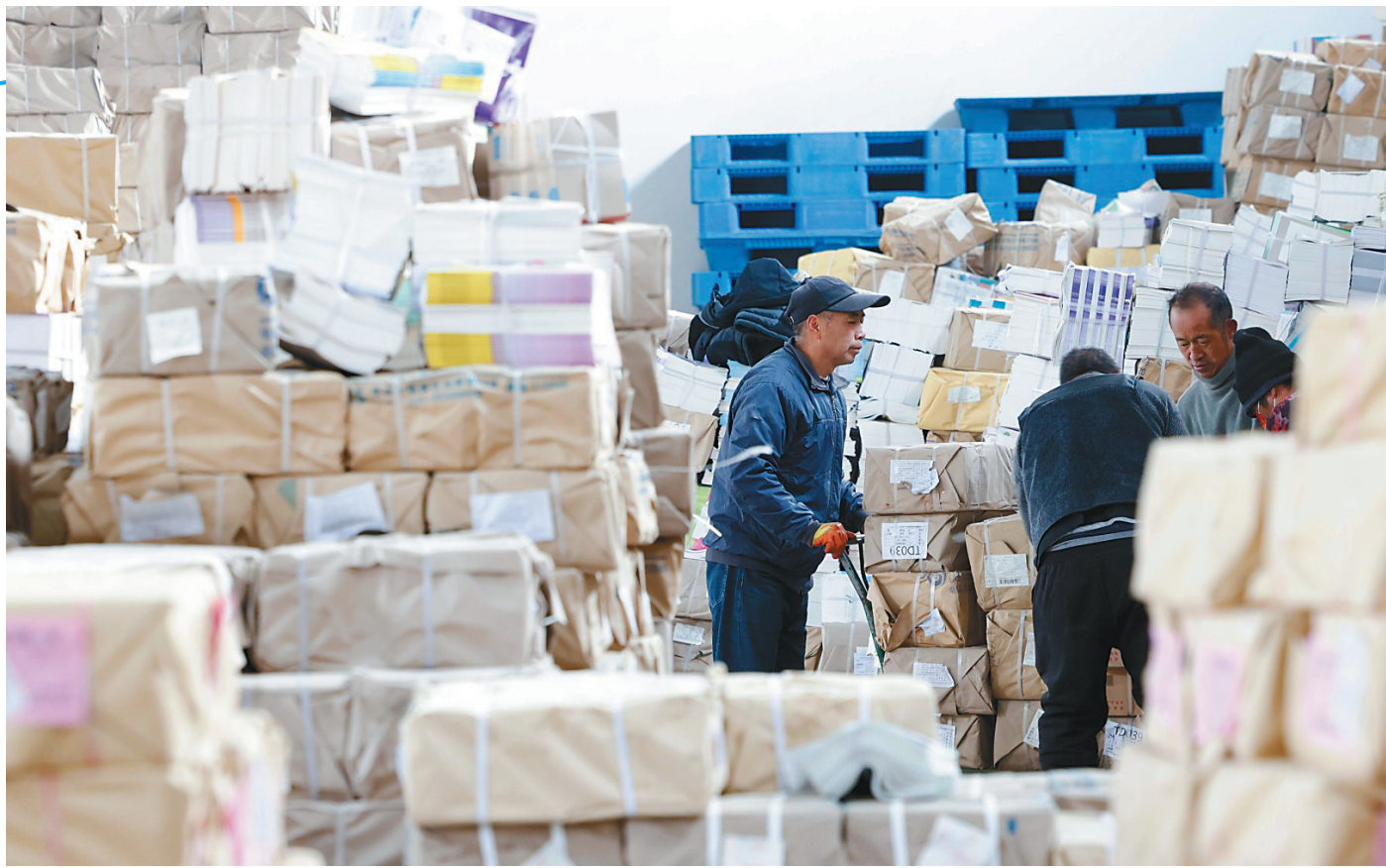
开学在即，泗洪县认真做好教材的清点、搬运、分发等工作，为新学期做好准备。图为2月2日，工作人员在泗洪县新华书店仓储中心分发教材。

“土”“特”“产”相互关联，不可分割。做好这三篇文章，要立足资源禀赋，突出地域特色，发展优势产业，提升乡村产业的层次和质量，让土特产的“金招牌”换来真效益，为乡村振兴注入源头活水。