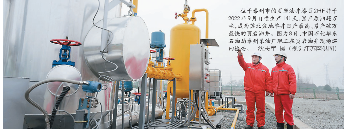
位于泰州市的页岩油井漆页2HF井于2022年9月自喷生产141天,累产原油超万吨,成为苏北盆地单井日产量最高、累产破万最快的页岩油井。图为8日,中国石化华东石油局泰州采油厂职工在页岩油井现场巡回检查。

涟水今年持续聚焦重特大项目攻坚,在前不久召开的“新春第一会”上,明确提出高举“工业强县”大旗,大力实施“2233”发展战略,充分发扬“四敢”精神,实施招商引资突破、项目建设提效、骨干企业培育、技改扩能升级、科技创新赋能、质量强企等“六大行动”,加快推动形成“百亿领航、10亿支撑、亿元支撑”项目矩阵;深化“四最”营商环境建设,打造“涟快办”品牌,推出“营商环境10条”服务承诺2.0版。