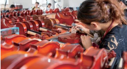
江苏凤灵集团成品车间