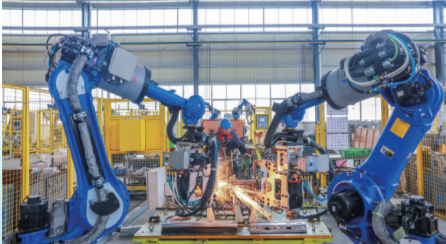
东华科技智能制造项目