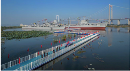
泰州海军舰艇文化园