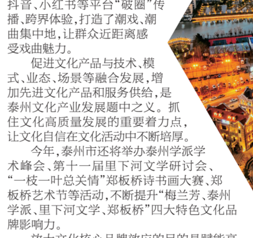
海陵区三水湾夜景