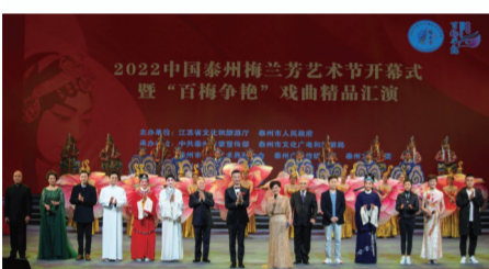
“百梅争艳”戏曲精品汇演