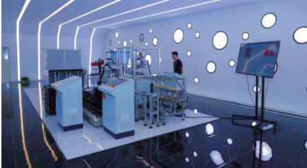
海陵工业4.0暨大数据中心产业基地