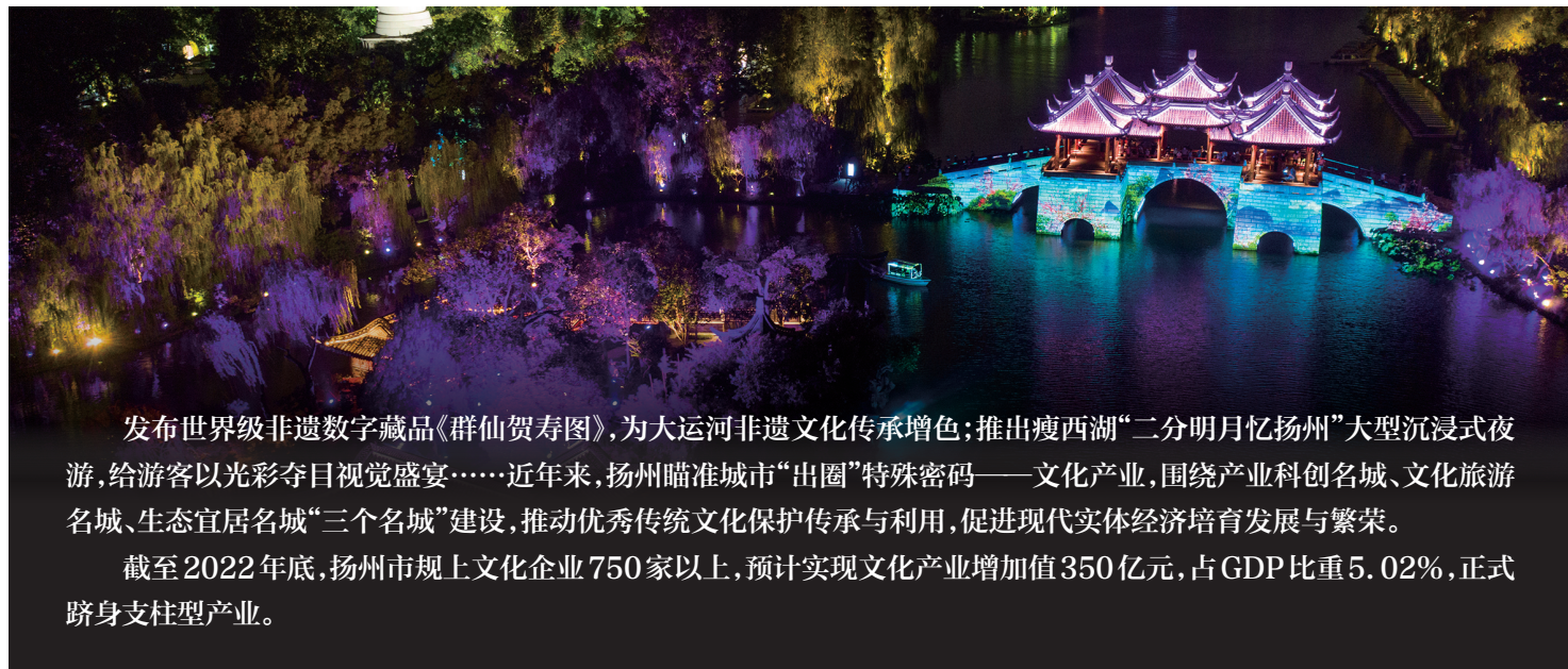
瘦西湖夜游灯光秀

发布世界级非遗数字藏品《群仙贺寿图》，为大运河非遗文化传承增色；推出瘦西湖“二分明月忆扬州”大型沉浸式夜游，给游客以光彩夺目视觉盛宴……近年来，扬州瞄准城市“出圈”特殊密码——文化产业，围绕产业科创名城、文化旅游名城、生态宜居名城“三个名城”建设，推动优秀传统文化保护传承与利用，促进现代实体经济培育发展与繁荣。