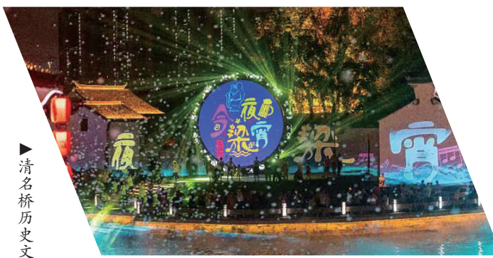
清名桥历史文化街区