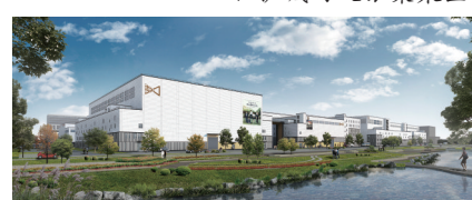
光线影视基地效果图