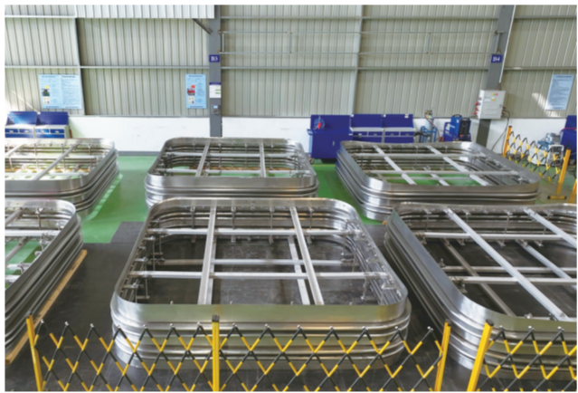
ITER计划的顺利推进贡献了智慧和力量。