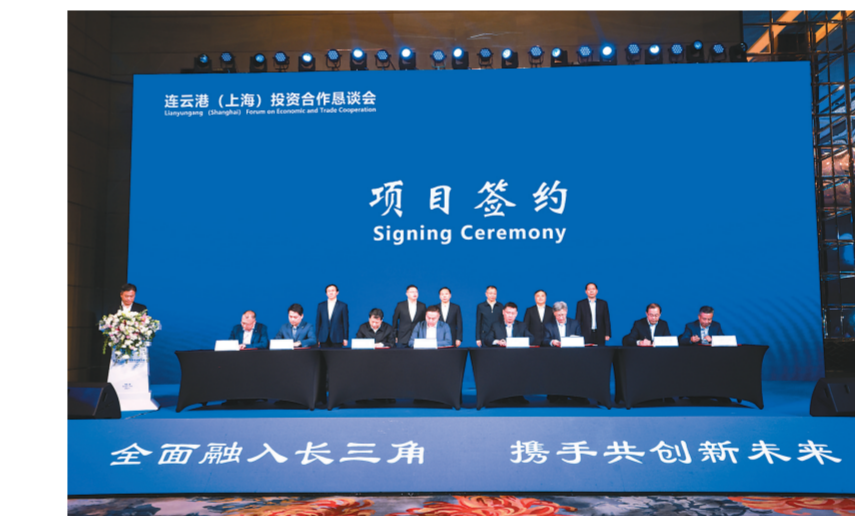
连云港在上海举办投资合作恳谈会,重点推介地方交流合作。连云港在沪举办投资合作恳谈会,重点推介地方交流合作。