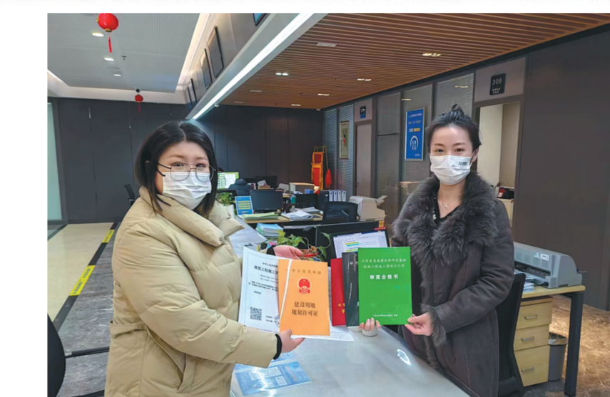
近日,中深孔智能岩芯钻机设备制造企业负责人同时拿到用地规划许可证、工程规划许可证等五证,连云港开发区拿地即开工模式成为新常态。

盛虹石化、卫星化学等链主企业均有大量的环氧乙烷产出,这种化学品不宜宜长距离运输,围绕该产品的产业链下游,徐圩新区投资