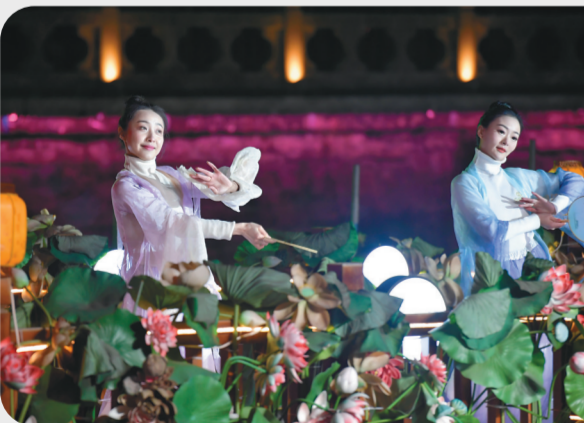
盐河水韵国潮夜演