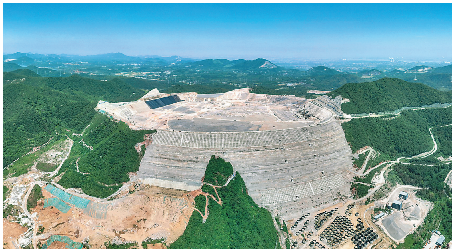
5月23日,航拍下水库已具备蓄水条件的国网新源江苏句容抽水蓄能电站。国网新源江苏句容抽水蓄能电站是国家电网公司“十三五”发展规划重点工程之一,是目前世界最高的抽水蓄能电站大坝、世界最高的沥青混凝土面板堆石坝、世界最大的库盆填筑工程。计划于2024年年底首台机组投运,2025年全部投产发电。

按照下半年工作安排,我将有机会到基层锻炼,做好调查研究正是重要一课。我将坚持以学促干,做到眼睛向下、脚步向下,经常“解剖麻雀”、不学“盲人摸象”,让工作多“接地气”,多“冒热气”,使措施不仅耐看更要耐用。 (作者单位为江苏省委组织部)