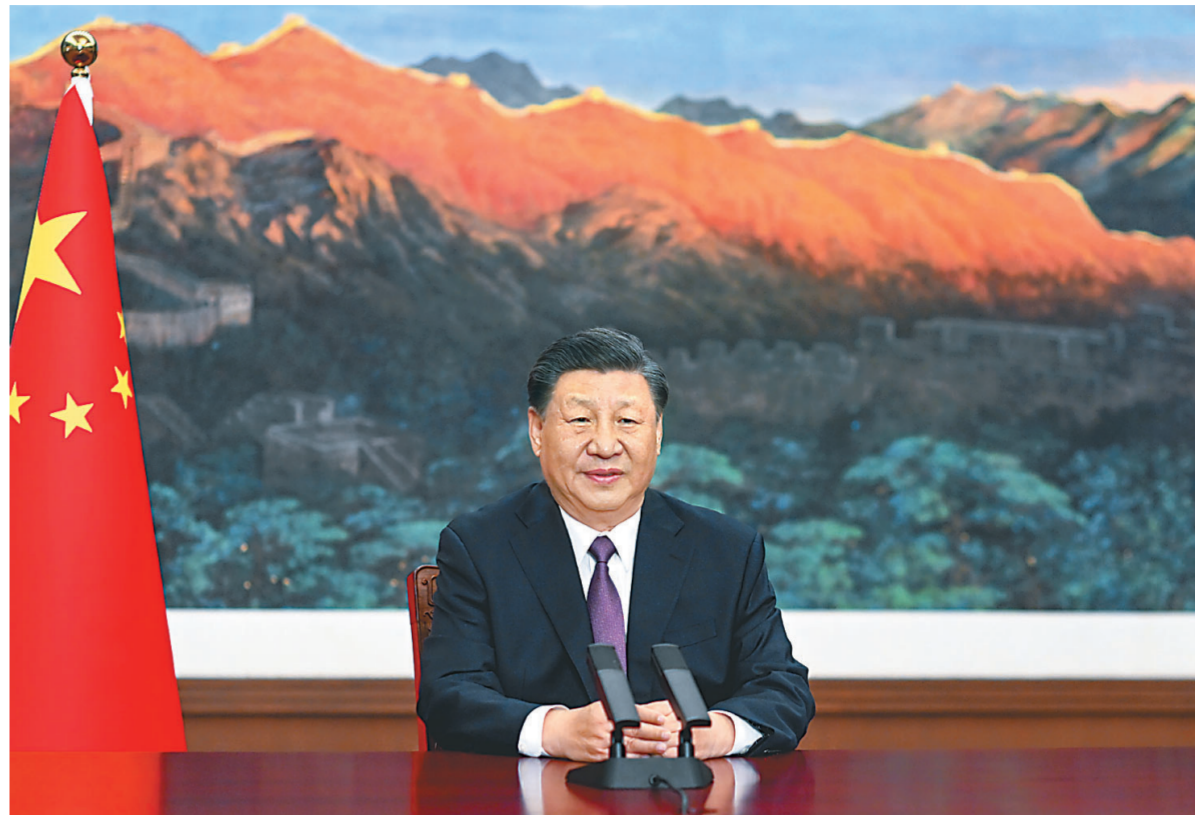
二十四日，国家主席习近平应邀以视频方式出席欧亚经济联盟第二届欧亚经济论坛全会开幕式并致辞。

新华社北京5月24日电 5月24日，国家主席习近平应邀以视频方式出席欧亚经济联盟第二届欧亚经济论坛全会开幕式并致辞。 习近平指出，当今世界正处于百年未有之大变局，世界多极化、经济全球化历史潮流势不可当。坚持真正的多边主义，推动区域协调发展，是国际社会广泛共识。亚欧大陆是世界上人口最多、国家最多、文明最具多样性的地区。面对动荡变革的世界，亚欧合作之路应该怎么走？这不仅关乎地区人民福祉，也深刻影响世界发展走向。