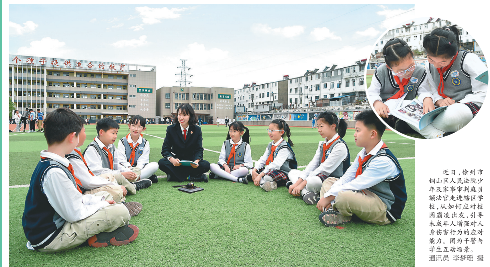
近日,徐州市铜山区人民法院少年及家事审判庭庭长法官走进辖区学校,从如何应对校园霸凌出发,引导未成年人增强对人身伤害行为的应对能力。图为干警与学生互动场景。

5G智慧校园助推沛县老年教育跨越式发展 本报讯(蒲照 孟晓东)全国老年大学数字化转型工作会议近日在深圳召开。会上,沛县老年大学校长张兴涛作了题为《5G智慧校园,助推沛县老年教育跨越式发展》的发言,受到与会人员好评。 去年4月,沛县老年大学抢抓机遇新建的沛县老年大学,按照中国老年大学协会《关于在全国老年大学开展5G智慧校园建设的通知》要求,与深圳金龄科技公司深度合作,突出“适老、智能、精准、高效”,投资超500万元,用5个月时间建成5G智慧校园,实现教务管理智能化、教育教学智能化、校园管理智能化、适老助老智慧化、宣传工作智能化,有力推动沛县老年教育高质量跨越式发展。 沛县老年大学在5G智慧校园建设取得经验,得到会议主持人、网上老年大学执行校长吴光权的充分肯定:“沛县高度重视老年教育工作,在5G智慧校园建设方面,投入大、标准高、措施实、速度快、质量优、效果好,其经验做法独具特色、成果丰硕,值得各地老年大学学习借鉴。” 本次会议由中国老年大学协会主办,多家中央部委直属老年大学、27个省(自治区、直辖市)的155所老年大学和多地老年大学协会有关负责人等近300人参加。