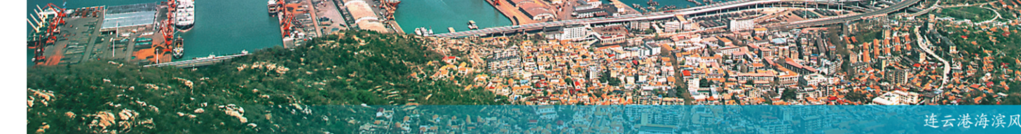
连云港海滨风光。

频频留下印记,有的已经消失,如静海、海西、宁海、海阳;有的虽然还存在,但其地域范围已经发生了变化,如海虞、海州。