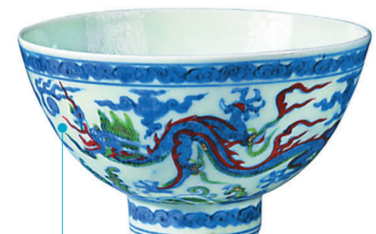
青花红绿彩云龙纹碗。

南京博物院收藏的“黄地青花花卉纹盘”也是正德年间的瓷器。盘子的中心绘有缠枝纹,以植物的枝干或蔓藤作骨架,向上、下、左右延伸,不仅蜿蜒多姿,优美生动,而且因为结构连绵不断,有生生不息、万代绵长的寓意。盘的四周内壁上绘有葡萄、荷花、石榴、柿子四式样花瑞果,外壁上绘有缠枝茶花器