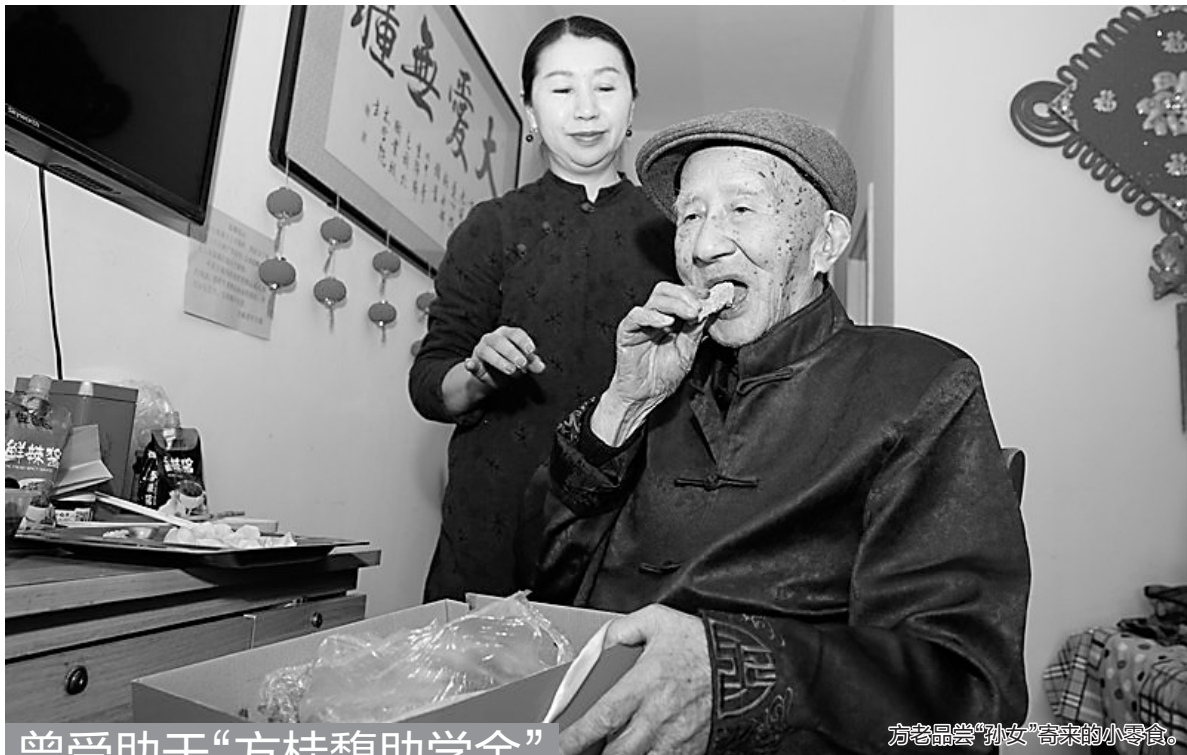
曾受助于“方桂馥助学金”