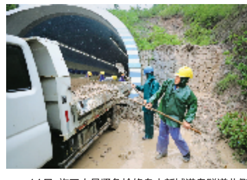
14日,施工人员紧急抢修舟山新城港隧道北侧的小面积山体塌方。