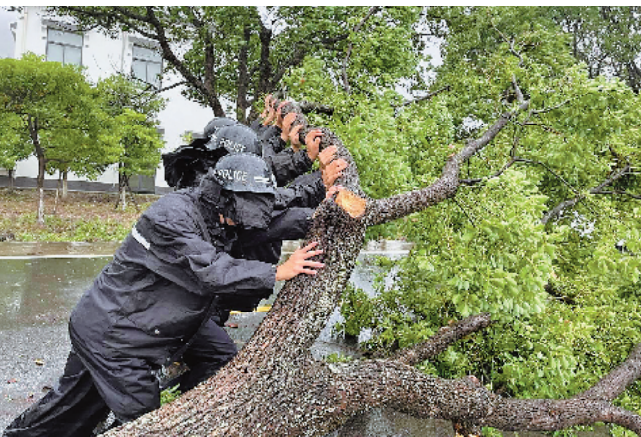
14日下午,舟山桃花镇派出所民警和交警合力将一棵被风吹倒的大树移到路旁。

烈的责任感,坚守岗位、尽职尽责,周密部署、精准调度,充分发挥好省指挥部作用,确保风险第一时间发现、第一时间管控、第一时间处置,牢牢守住安全底线,用党员干部的辛苦付出换取人民群众的绝对安全。14日下午,王浩赶赴西险大塘查看防汛防台有关情况。他强调,西险大塘是杭州北部一道重要的防洪屏障,必须坚持底线思维、极限思维,切实把困难估计得更充分,把措施部署得更周密,把工作抓得更细致,坚决打好防汛防台主动仗。要强化巡查巡险,特别是强降雨期间要增派巡查力量,落实“百米一人、严防死守”巡查制度,确保险情早发现、早处置。徐文光、刘忻参加会或检查。