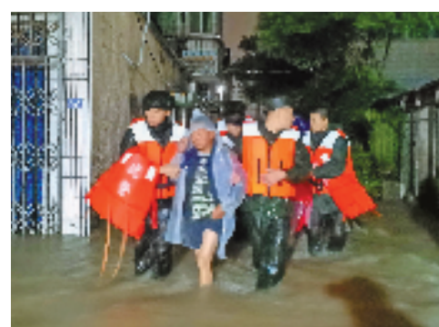
14日晚,武警宁波支队官兵赶赴宁波市海曙区洞桥镇树村转移受困群众。