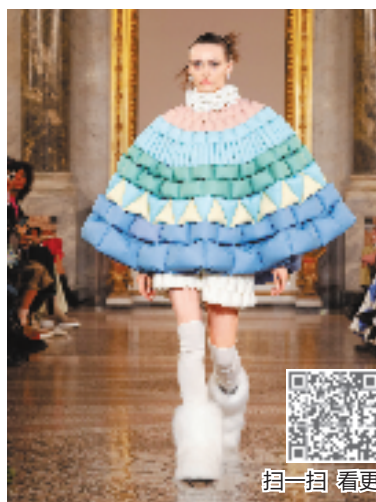
在米兰塞萨尔贝罗尼皇宫,模特身着沈威廉全新设计的羽绒服走秀。

用,积极助推各项部署任务在我省落实落地。要以更优机制构建良法善治,全面落实立法法修改精神,加快构建省域法规制度体系,持续完善立法工作机制,深化民主立法开门立法实践,切实维护法治权威统一,推动我省立法工作再上新台阶,发挥监督支持推动作用,发挥决定权“短平快”作用,发挥人大代表凝心聚力作用,发挥基层人大基础支撑作