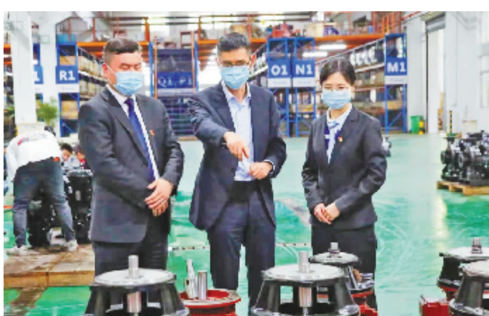
建行金融指导员走访企业