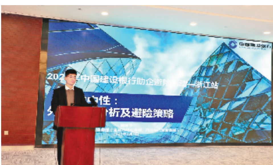
建行举办外贸企业汇率避险政策宣讲会