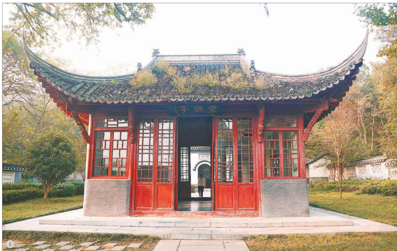
①丰乐亭 ②菱溪石 ③醉翁亭 ④琅琊古寺

虽然家贫，但欧阳修从小受到了良好的启蒙教育，他凭借着过人的天资以及好学之心，用功苦读，决心科考。宋仁宗天圣元年（公元1023年），十七岁的欧阳修于随州应试，虽然他的答卷内容很是优秀，但却因不符合句子韵脚的要求而落榜。宋仁宗天圣四年（公元1026年）再试未中的欧阳修遇到了时任汉阳知军的胥偃，并以其出众的学识和文采给胥偃留下了深刻的印象。宋仁宗天圣七年（公元1029年），受胥偃的保举，欧阳修参加了国子监广文馆试，同年又参加了解试，并均取得了第一名。次年，欧阳修于礼部省试中再获第一。宋仁宗天圣八年（公元1030年），由于过于显露锋芒，欧阳修在宋仁宗主持的殿试中被唱为第十四名，至此，走了多年科举之路的欧阳修终于正式