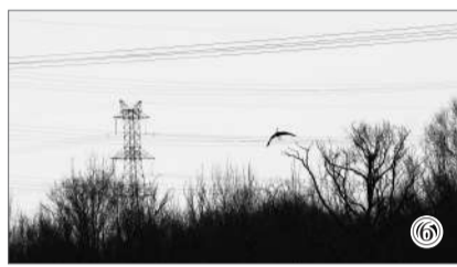
姜方洲获奖摄影作品： ①平衡木 ②金光映鸭 姜方洲摄影作品： ③白秋沙鸭 ④普通鸫鹛 ⑤蒙古寒蝉 ⑥苍鹭