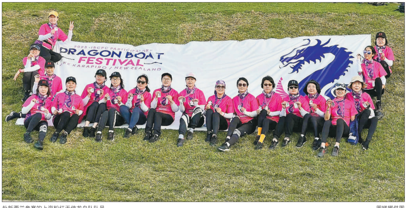
赴新西兰参赛的上海粉红天使龙舟队队员。