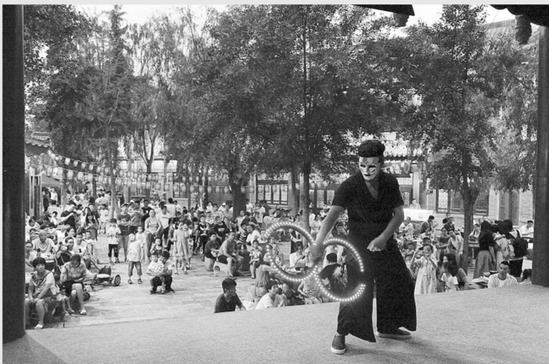
带你一站式尝遍河南美食。据悉,绿博之夜活动将持续至8月19日。期间绿博园的营业时间为:周一至周五8:30~21:00,22:00闭园;周一至周四8:30~18:00,19:00闭园。

除了精彩的演出,各类美食也是必不可少的。本届绿博之夜活动期间,郑州绿博园主打老家味道美食街,各类河南特色美食一应俱全,