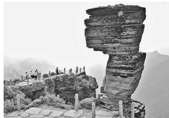
梵净山美景

相关部门不断加大政策支持力度,引导金融机构聚焦单户授信500万元及以下小微企业信贷投放。央行数据显示,一季度,单户授信500万元以下的小微企业贷款新增499亿元,达到去年全年新增额的71.7%。