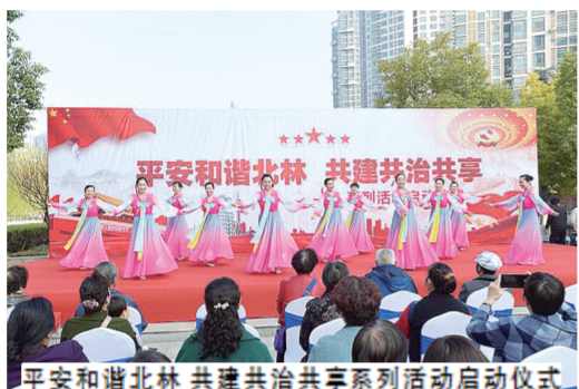
平安和谐北林 共建共治共享系列活动启动仪式

早在今年初, 北林路街道党工委就审时度势, 超前作为, 提出发展“设计图”——把基层党建作为固本之源, 以强化政治功能和服务功能为龙头, 围绕和服务经济社会发展这个中心, 认真落实中央和省市区委工作部署, 紧紧围绕郑州建设国家中心城市和“四重点一稳定一保证”工作总格局, 牢牢盯住“实现两个率先, 领跑中部城区发展”奋斗目标, 以全面形成领跑中部城区发展决定性态势为主线, 以城中村改造为契机, 以经济结构调整为依托, 坚持敬业、负责、担当, 突出党建保障, 突出民生指标, 突出经济提质, 积极推动辖区经济社会各