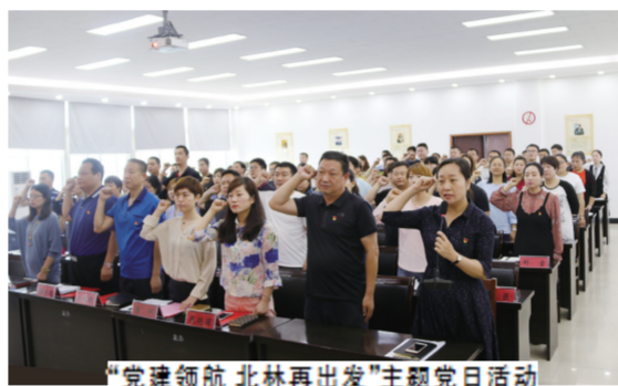
“党建领航 北林再出发”主题党日主题活动

设计引领, 行稳致远。北林路街道在全面推进党建工作持续深入的同时, 街道始终将全