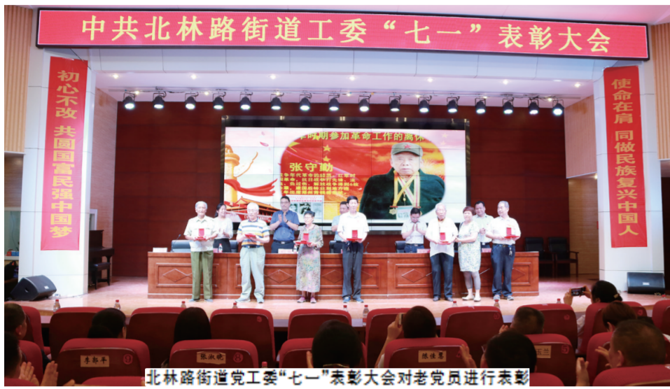
北林路街道党工委“七一”表彰大会对老党员进行表彰