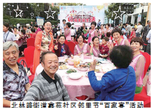
北林路街道鑫苑社区邻里节“百家宴”活动

凝聚党建合力, 构建区域性共建格局, 从“谋共建共治 促共享共赢”座谈会入手, 通过建立民情恳谈会、问题协调会、工作评价会“三会一体”的议事协调机制, 充分运用“一征三议两公开”工作法, 积极推进驻区单位与党工委之间的共建共治共享, 为群众解决了一大批热点难点问题, 形成了党建引领、居民参与、单位