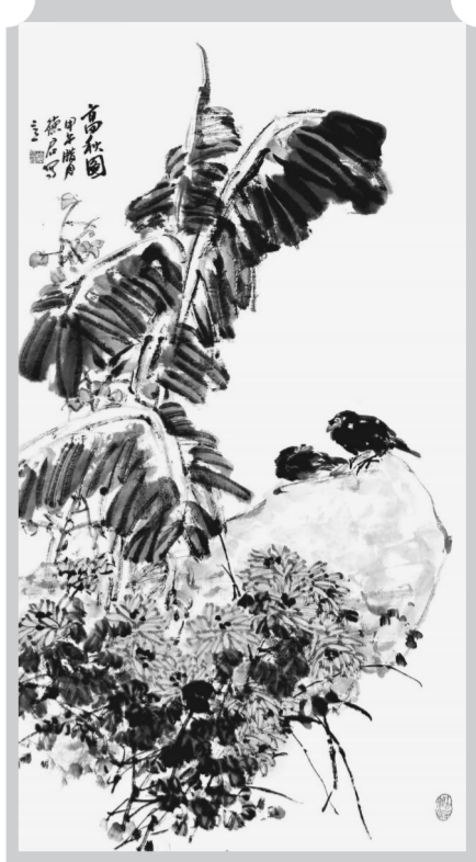
高秋图(国画) 李德君

元结中年得志，一生文韬武略，其忠直方正的人格，践行了“修身齐家治国平天下”的人生境界。200年后，张载著名的横渠四句：“为天地立心，为生民立命，为往圣继绝学，为万世开太平”，仿佛诠释了元结的一生。