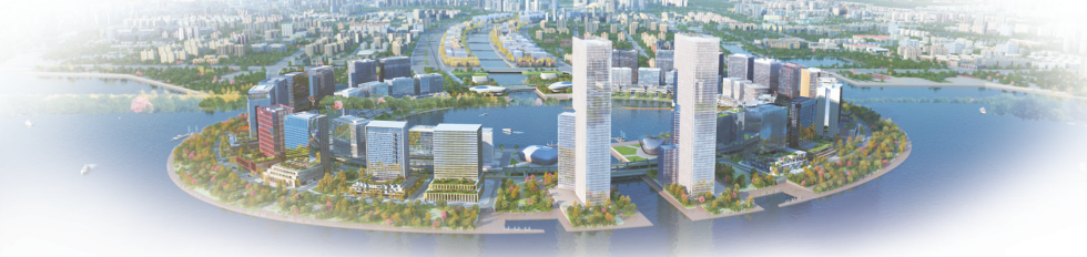
北龙湖金融岛鸟瞰效果图

一花一世界，一沙一人情。如果说一滴水可以反射太阳的光辉，则位于风起云涌、风生水起郑州北龙湖北岸的福晟·九州府，如出彩中原的一抹姹紫嫣红，如硕果满枝的春华秋实，在丰收的秋日迎来了大美绽放，引来记者驻足流连。