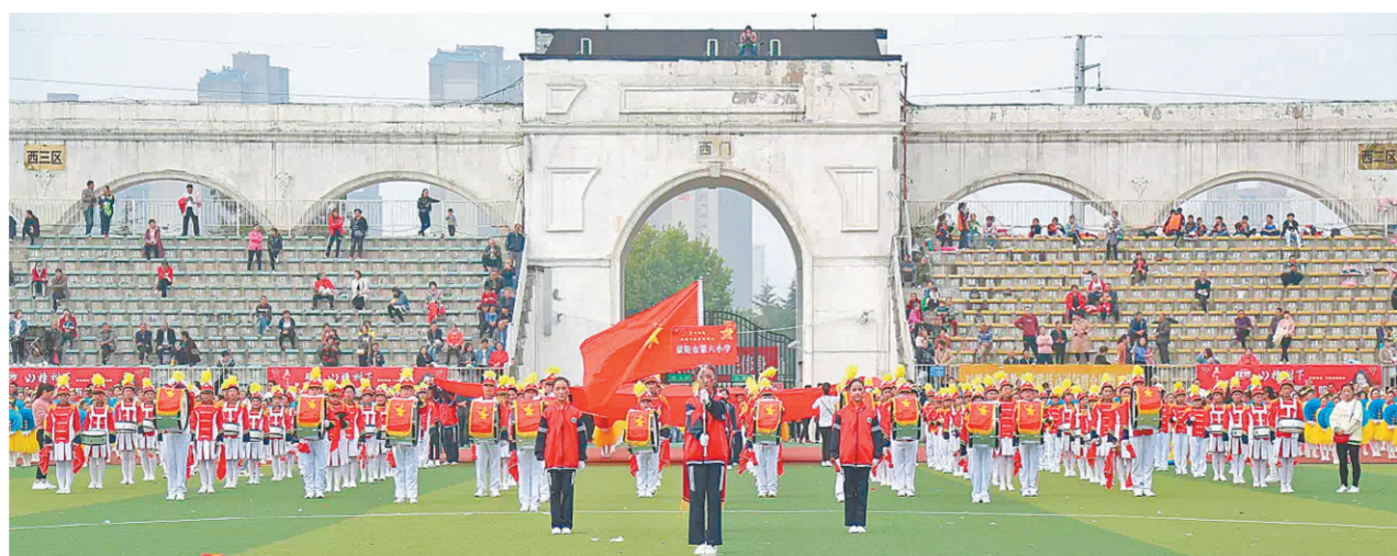
本报讯(记者 史治国 通讯员 蒋士勋 文/图)为庆祝中华人民共和国成立70周年,纪念少先队建队70周年,教育引导广大少先队员听党话、跟党走,10月12日上午,荥阳市2019年“童心

向党 红领巾追梦新时代”少先队鼓乐队大检阅活动在荥阳市体育馆举行。鼓号队是少先队组织的象征,是展示校园精神风貌的良好形象。一次展演需要少先队员们协同配合、挤压时