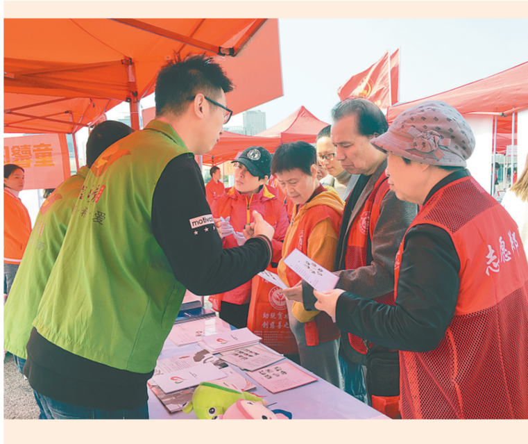
有效落实推进“不忘初心 牢记使命”党员主题教育,昨日上午,郑东新区联盟新城社区组织支部党员、党员志愿者、党员社工,参加河南省、郑州市脱贫攻坚志愿服务宣传展示暨“郑公益”优秀公益慈善项目交流活动。大家相互交流,共同为慈善事业的发展贡献力量。

目前,百花社区正多措并举、全力以赴加快改造工程进度,结合老旧小区实际与居民的意见和建议,制定切实可行的方案,彻底整治老旧小区环境,通过改善人居环境,为人民群众安居乐业打造和清美好家园,增强群众的获得感,以此深入推进“不忘初心 牢记使命”主题教育工作开展。