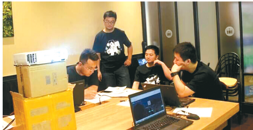
研发团队工作状态

郑州比特软件有限公司(简称比特软件)成立于2017年,位于经开区留创园兴华产业园,是一家专业提供互联网金融整体解决方案的创新型科技企业,拥有10多项软件著作权和专利,同时提供面向供应链金融、消费金融与产业金融等“全生态”金融解决方案和服务。主要服务于传统金融机构、上市公司、国有企业、投资担保、基金理财、融资租赁等金融和类金融机构。比特软件旗下的产品包括:智能投顾平台、智能跟单交易系统、大数据精准营销平台、个人风险评估平台、行情资讯服务平台、财经数据金融终端。比特云旗下的产品包括:企业定制数据库模型、精准投放平台、用户画像分析平台、舆情聆听平台。记者 王赛华 见习记者 卢尚卿