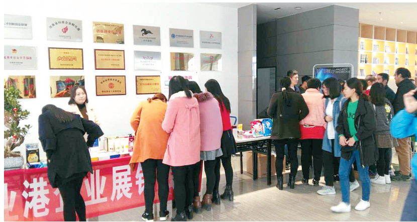
富雷格园区展销会