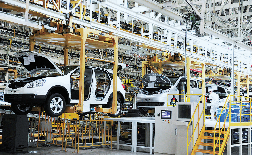
郑州日产生产车间 记者 马健(资料图片)