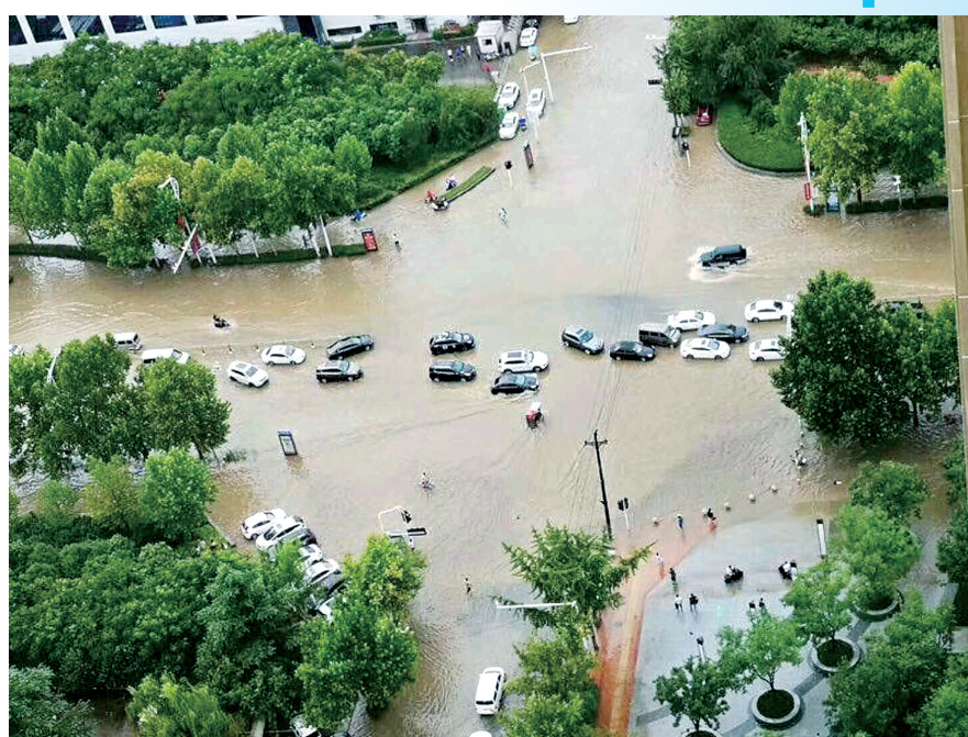
高新开启“看海模式”