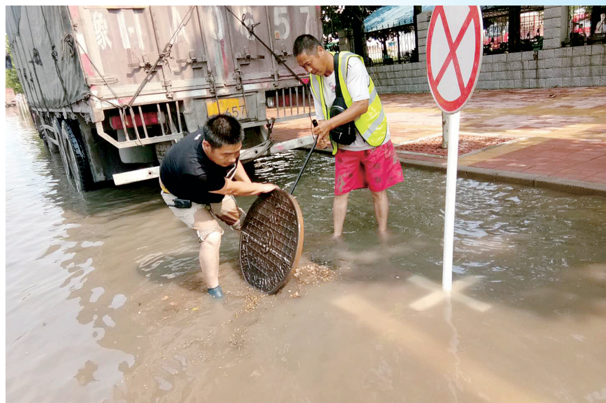
打开窨井盖、设立警示牌,帮助泄洪