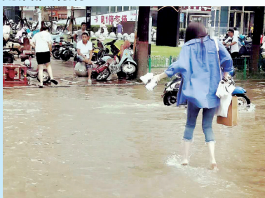
一手提鞋,一手掂包