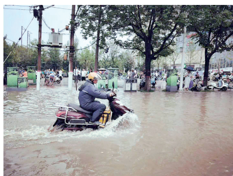
快递小哥蹚水前行