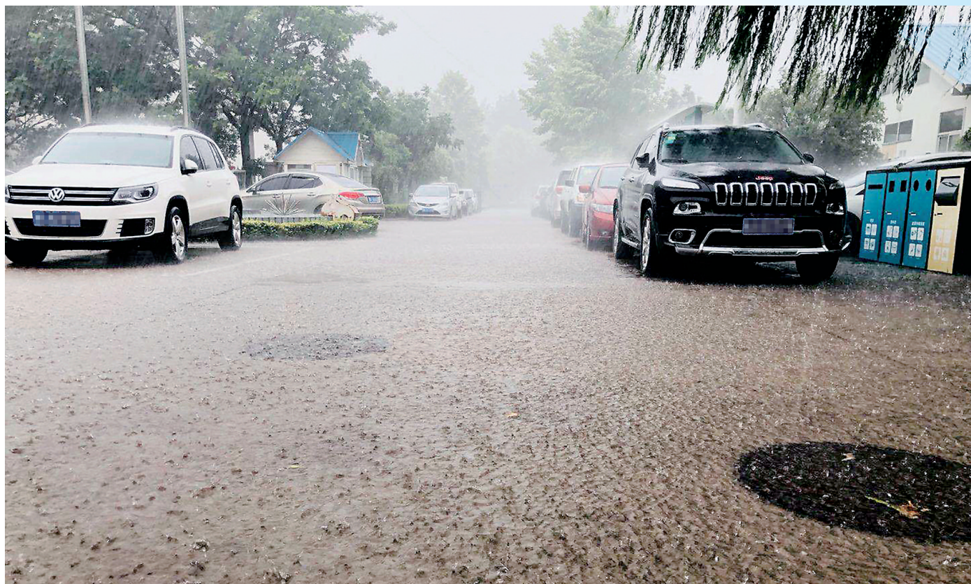
大雨倾盆,沉渣泛起