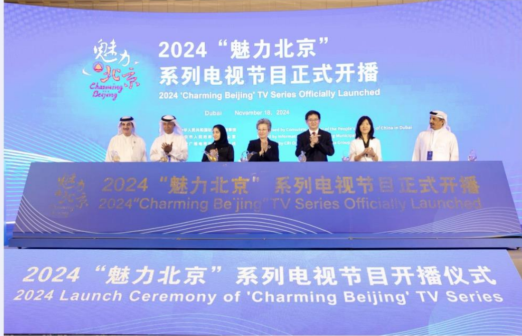
“魅力北京”系列电视节目海外开播仪式现场

当地时间11月18日，由中国驻阿联酋迪拜总领事馆指导，北京市人民政府新闻办公室主办，国际在线承办的“魅力北京”系列电视节目海外开播仪式在阿联酋迪拜举行。2024“魅力北京”系列电视片将正式开启在阿联酋阿布扎比电视台和沙特阿拉伯卫星电视台等平台的展播。