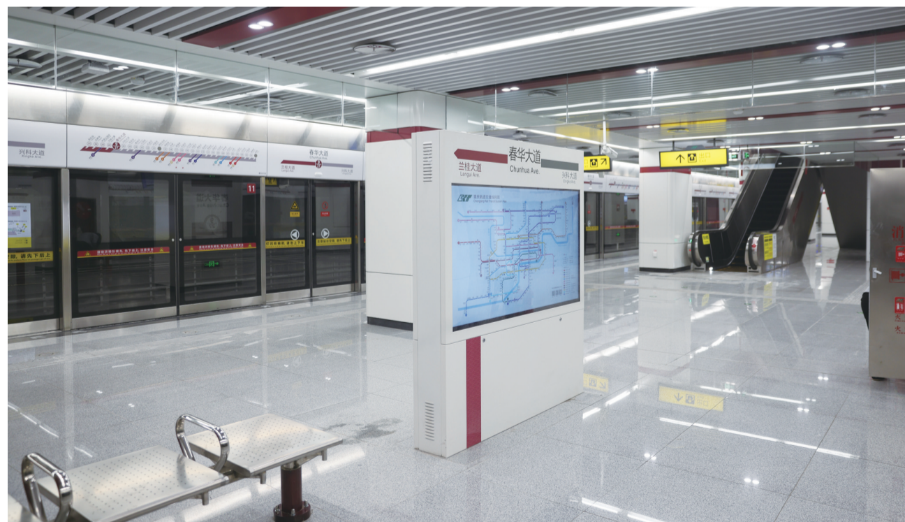
轨道交通9号线二期春华大道站

1月18日,随着醒目的“洋铁红”标识列车从兴科大道站缓缓驶出,轨道交通9号线二期兴科大道—花石沟正式通车投入初期运营。这也标志着由重庆机电控股集团机电工程技术有限公司(以下简称“机电工程公司”)承建的轨道交通9号线二期项目站后工程全面完工,工程移交基本完成。