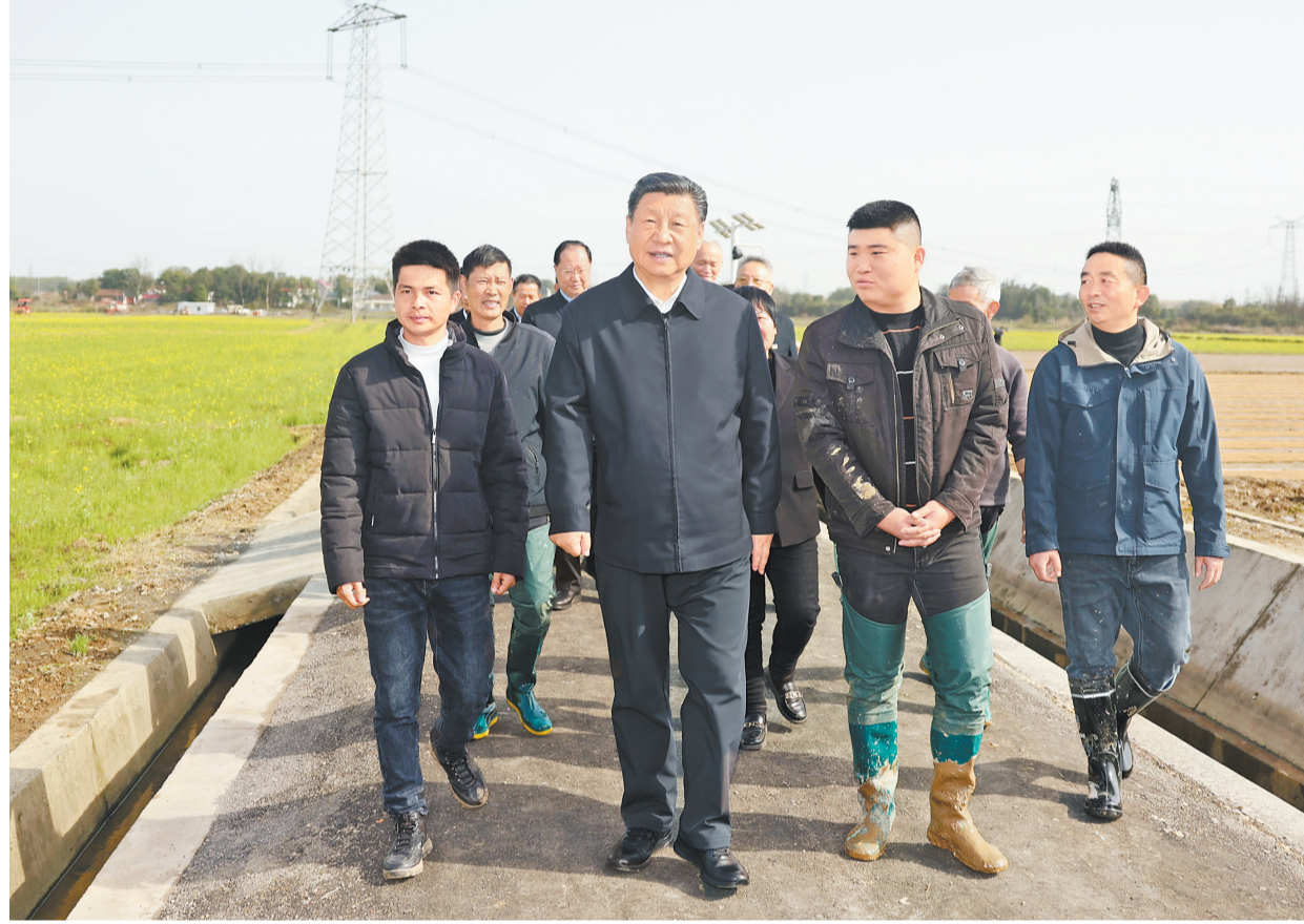
3月18日至21日，中共中央总书记、国家主席、中央军委主席习近平在湖南考察。这是19日下午，习近平在常德市鼎城区谢家铺镇港中坪村，同种粮大户、农技人员、基层干部亲切交流。

新华社长沙3月21日电 中共中央总书记、国家主席、中央军委主席习近平近日在湖南考察时强调，湖南要牢牢把握自身在构建新发展格局中的战略定位，坚持稳中求进工作总基调，坚持高质量发展不动摇，坚持改革创新、求真务实，在打造国家重要先进制造业高地、具有核心竞争力的科技创新高地、内陆地区改革开放高地上持续用力，在推动中部地区崛起和长江经济带发展中奋勇争先，奋力谱写中国式现代化湖南篇章。