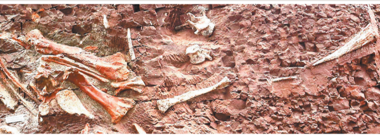
保存于化石墙上的“元始巴山龙”标本。