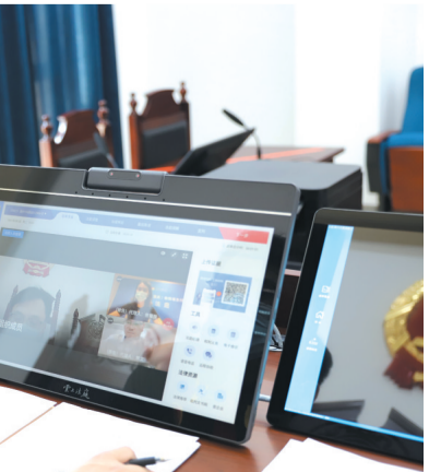
2021年8月,江津区法院法官通过“云上法庭”审理一起商品房预售合同纠纷案