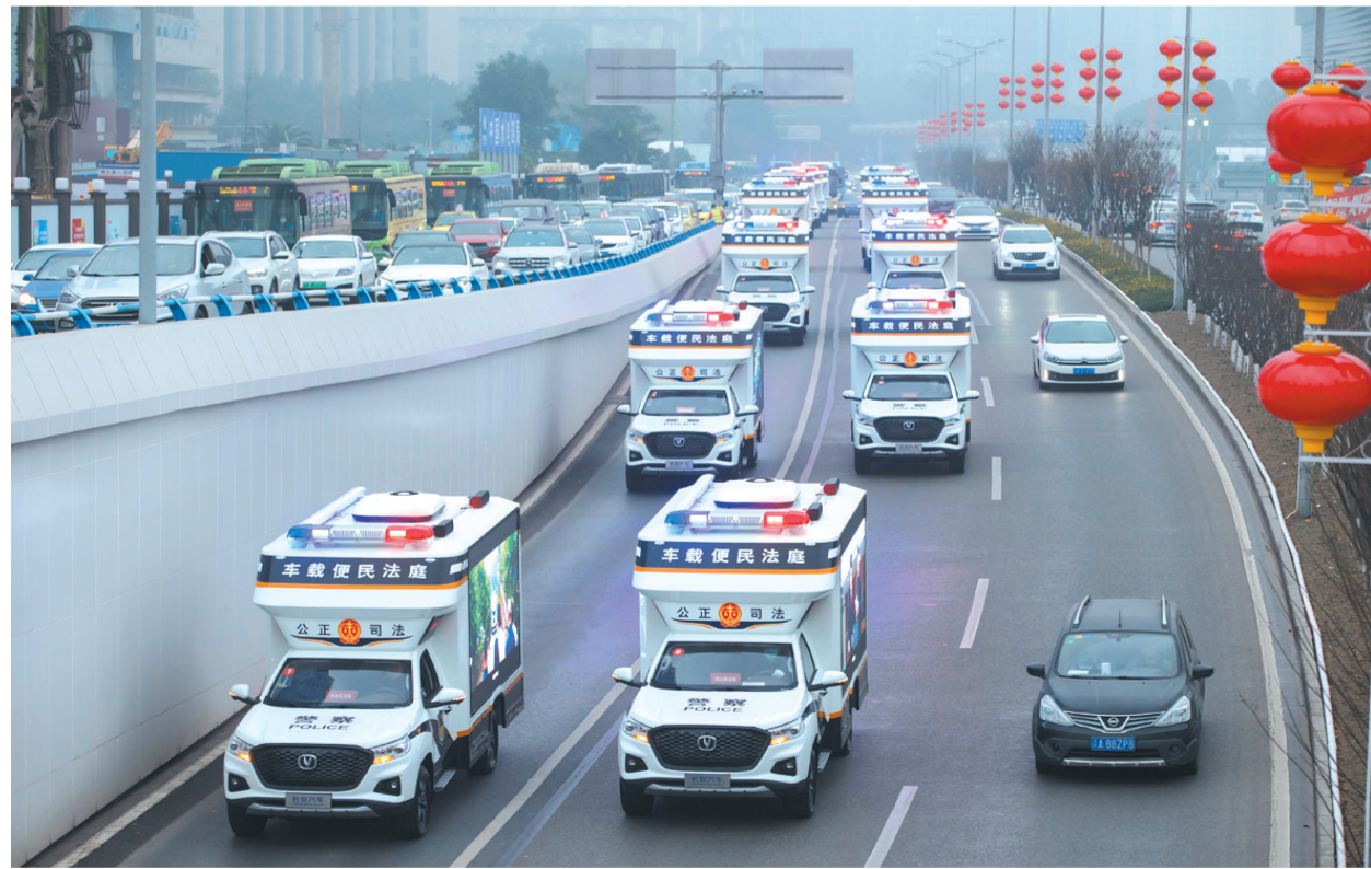
2022年1月,重庆法院“车载便民法庭”首批车辆交付给万州、涪陵等20家基层法院

发展规划(2021-2025)》提出打造人民法院信息化4.0版的奋斗目标。为打造具有重庆法院特色的信息化4.0