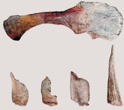
元始巴山龙肩胛骨、鸟喙骨、剑板及尾刺骨骼化石。

市规划和自然资源局相关负责人表示,下一步,重庆将继续做好云阳恐龙动物群的保护、发掘、研究和利用工作,尽可能早日让大众体验恐龙化石“博物馆”的魅力。