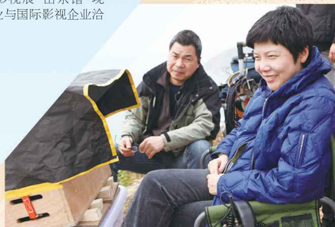
■著名女导演黎妙雪(右)为青岛拍了一部电影“情诗”《恋之风景》。

钟剑伟不仅把公司落在青岛，还把他多年的古建筑构建、古家具带到了青岛，这些曾经出现在《黄飞鸿》《新龙门客栈》等影片里的珍贵收藏，也是后续电影人的宝贵资源。“一部戏拍完了应该做个纪录片或者做一本书，让后人知道当年是如何把这部戏做出来的。现在很多人读书不成才去做电影，缺乏匠人的自豪感、荣誉感。来到东方影都，我希望把我的经验和匠人精神传给下一代。电影要进步，就要有匠人精神。”