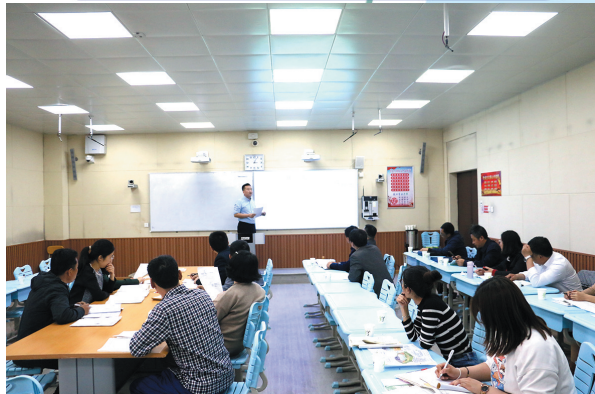
即墨二中进行校内学科集备活动。