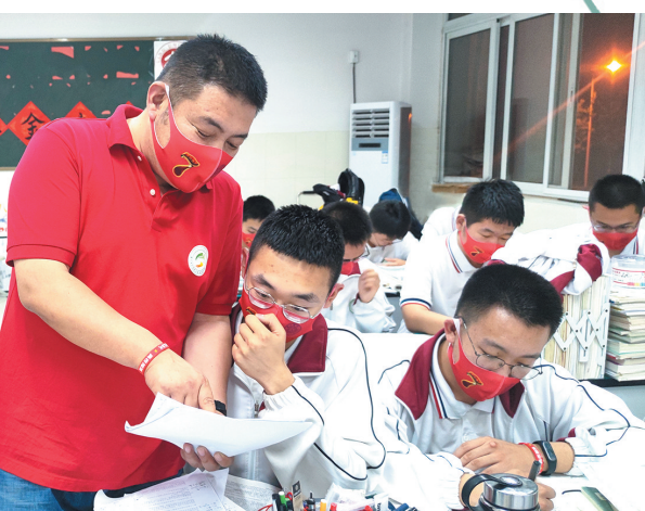
即墨实验高中老师课堂上指导学生。