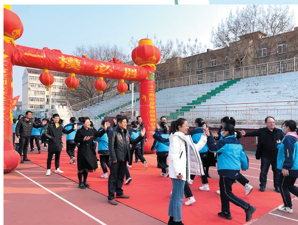
即墨一中举办成人仪式暨高考百日誓师大会。