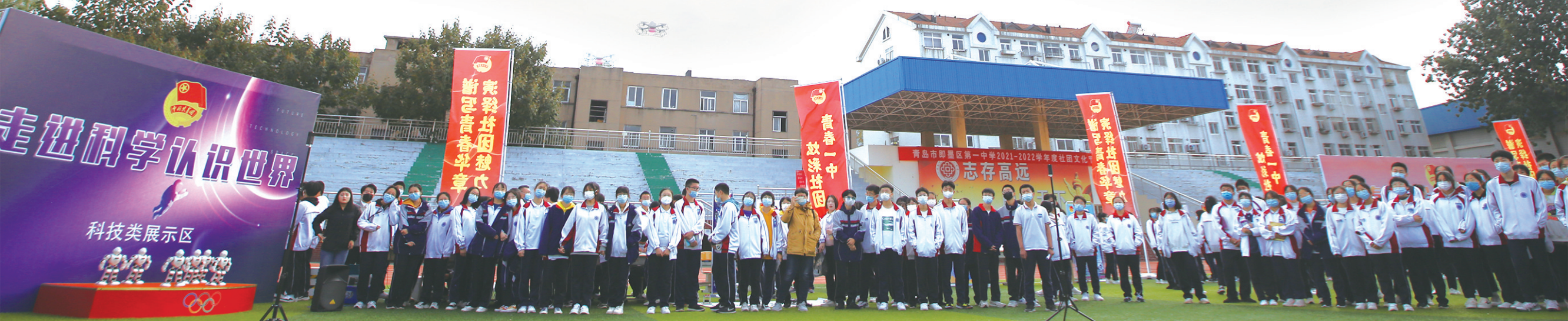
即墨一中“团团大集”上无人机编队表演。