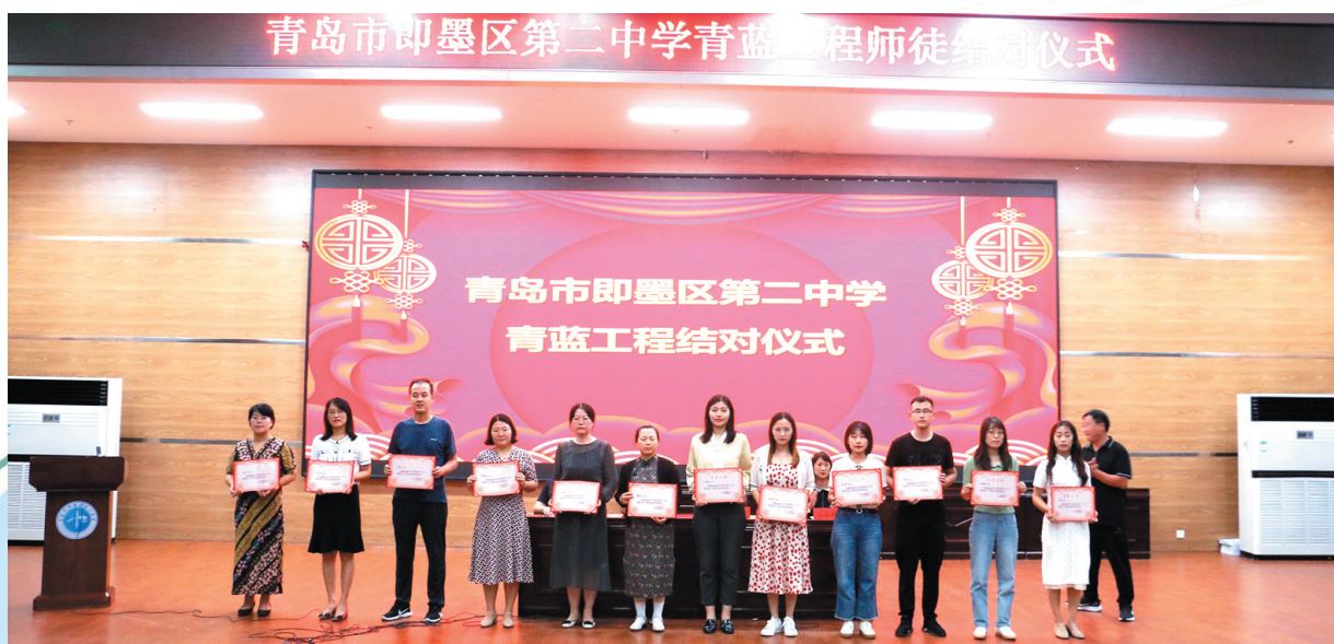
即墨二中举行青蓝工程结对仪式。

承办青岛市高中教育教学工作现场会并作典型经验介绍;高中教育改革成果获青岛市教育改革创新奖……即墨区坚持一张蓝图绘到底,在“办好人民满意的教育”这张答卷上的成绩愈发亮眼,高中教育区域示范样板逐步形成。