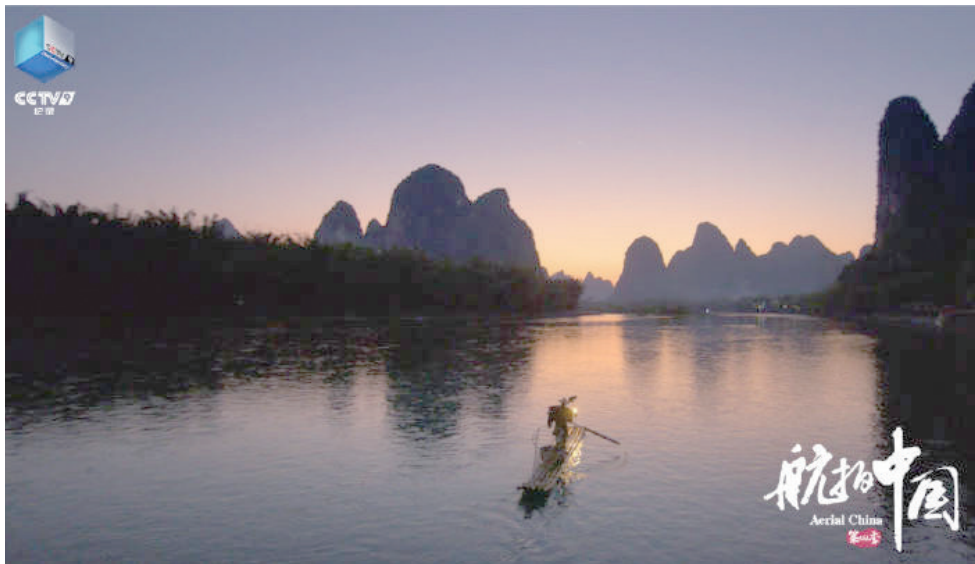
《航拍中国》(第四季)剧照。

誉为“地球最美的弧线之一”的龙脊梯田等，将厚重的人文历史、因地制宜的人类奋斗史娓娓道来。