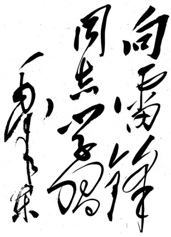
毛泽东主席亲笔题词“向雷锋同志学习”。