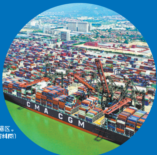
繁忙的厦门港区。

优良的营商环境,进一步提升了发展能级。吴朝阳表示,在未来,远海码头将继续利用厦门自贸片区的区位优势,拓展码头延伸服务,向港口综合物流服务商转型。