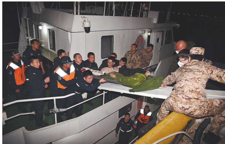
救援人员将伤者转移至执法艇上。