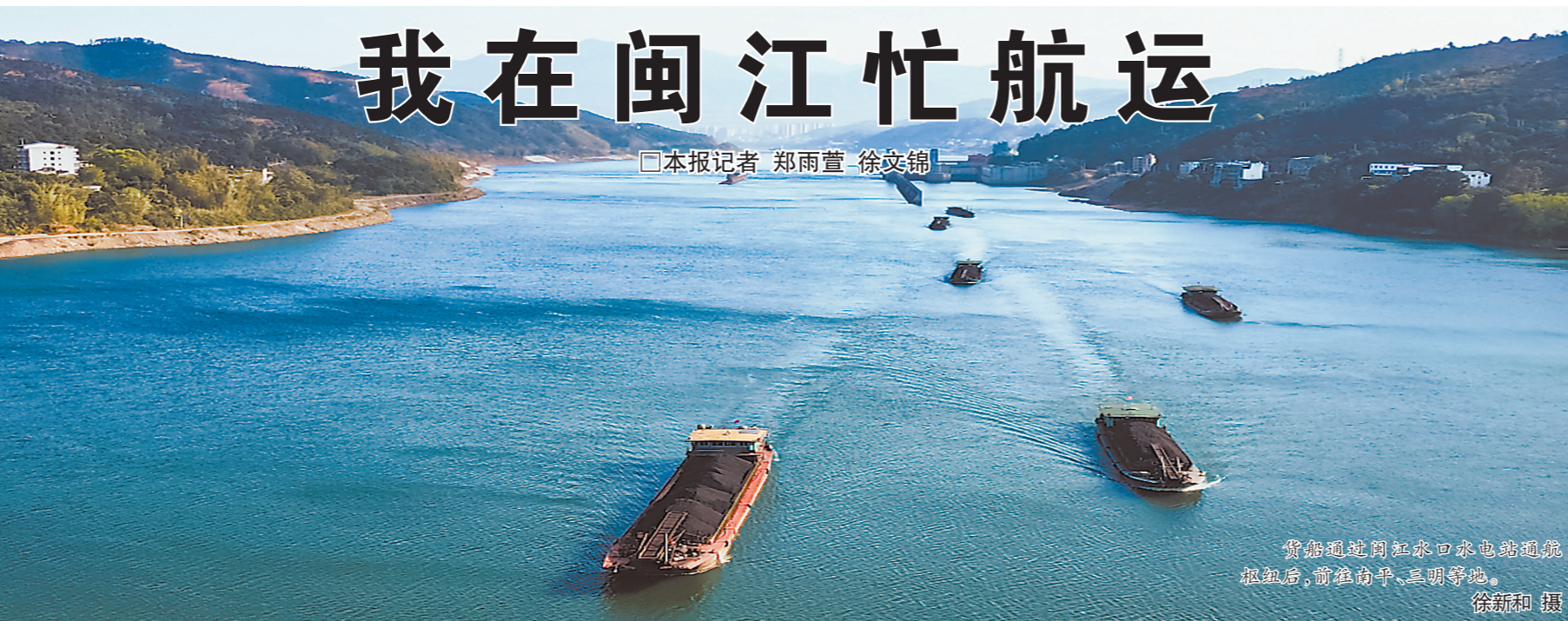
货船通过闽江水口水电站通航枢纽,前往南平、三明等地。