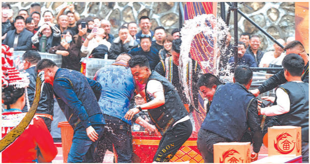
11日，霞浦县2024年“三月三”传统歌会暨霞台非遗文创节在永安市清水畲族乡茶岗村开幕。图为畲族传统抢“秧酒”活动。