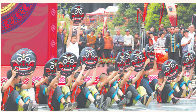
11日，为期4天的第七届“三月三”畲族民俗文化节活动在永安市清水畲族乡开幕，邀请八方宾朋共享畲乡文旅盛宴。

畲乡人民从水库建设大局、舍小家为大家的奉献精神，以及小沧畲族乡干部群众顽强拼搏、用智慧和汗水建起幸福美丽新家园的故事。 本次“三月三”活动共设置12个板块，多样的场景布置让群众充分参与畲乡民俗活动，感受独特的节日氛围。 小沧畲族乡建乡以来，已多次举办“三月三”民俗文化活动，并于2016年与台湾屏东县玛家乡缔结友好姐妹乡协议。今年的“三月三”活动，不仅邀请台湾同胞参加，还布置了“台湾市集”专区，汇集了来自台湾的优质农产品、文创、美食小吃等，通过民俗文化的深入交流，助力两岸融合发展。