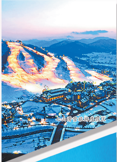
七山滑雪场度假区