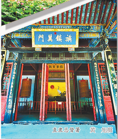
直隶总督署