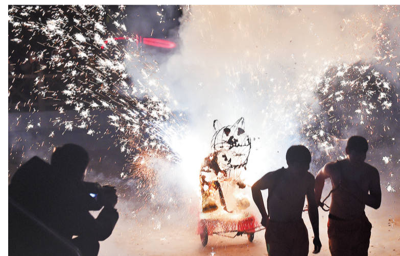
2月5日晚,井陘县卧虎岭生态农业休闲园上演精彩的南张井老虎火。井陘县南张井老虎火,距今已有300多年的历史。火是当地村民对烟火的俗称。老虎火就是用制作成老虎状的道具放烟火。2008年6月,南张井老虎火被列入国家级非物质文化遗产名录。

实施工程技防升级行动。推进建筑工地上信息化、智能化管理建设,实现施工现场可视化监管和危险性较大的分部分项工程信息化监管。