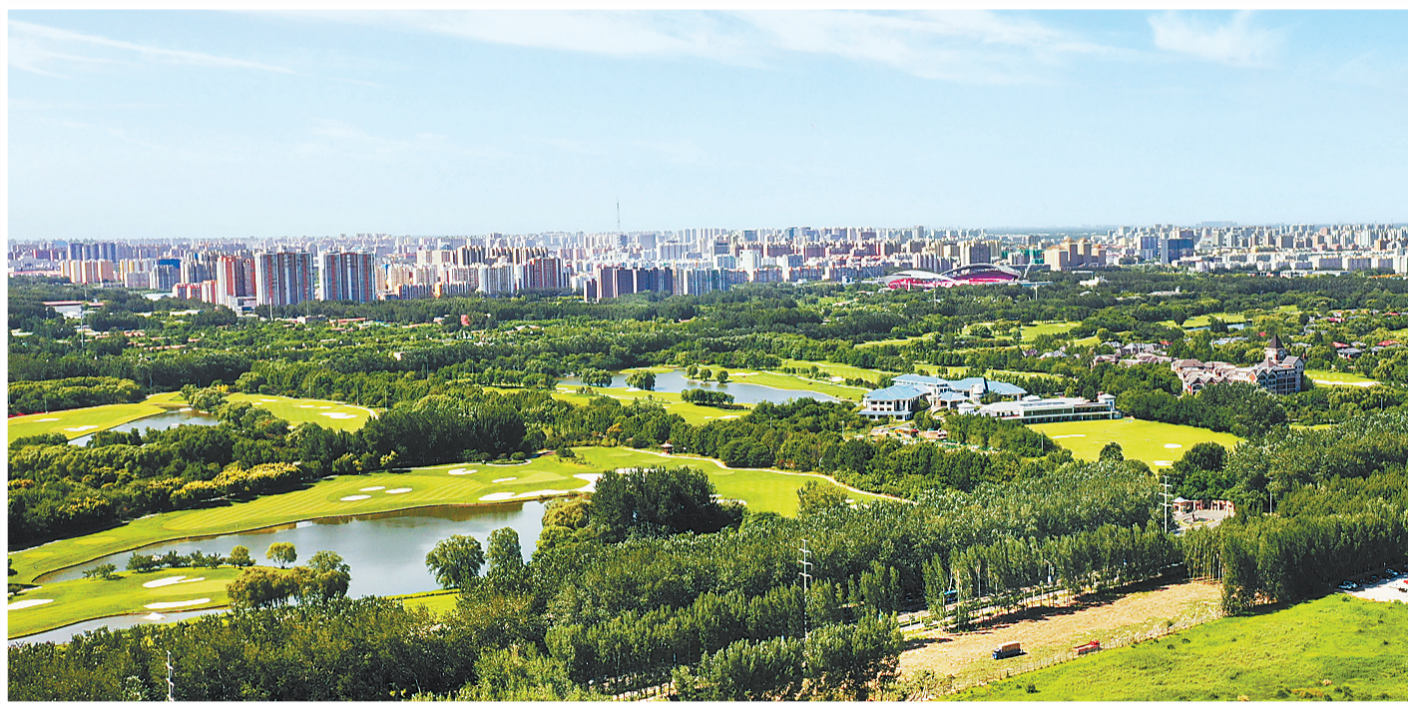
上图:廊坊市主城区被绿树环抱,尽显生机。中图:近日,在廊坊市生活垃圾焚烧发电项目中控室内,工作人员正在监测各项数据。

进一步为居民打造设施完善、环境良好、管理有序的居住环境,今年,廊坊市将继续加大城镇老旧小区改造力度,计划完成城