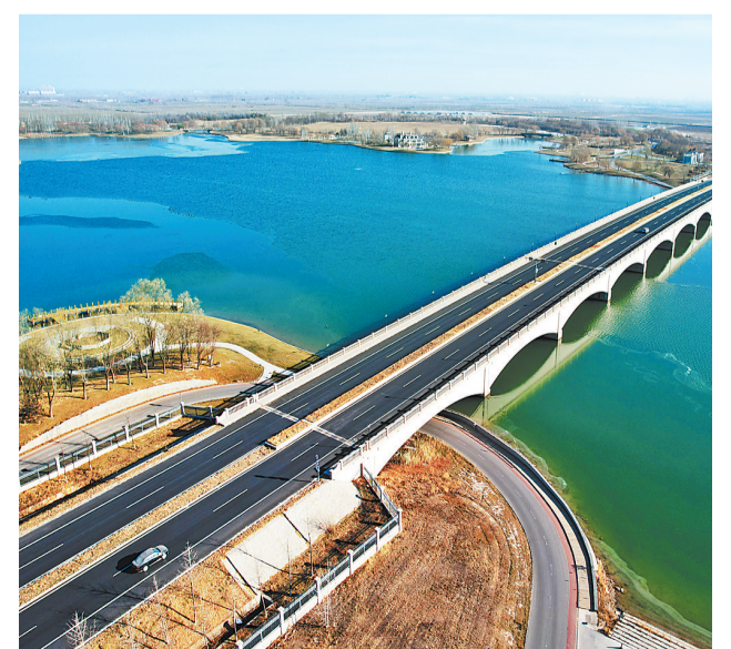
近年来,文安县不断加大交通基础设施建设,完善城乡路网布局,形成了内外衔接、城乡互通的交通网络格局,有效改善了群众出行环境。这是廊沧高速大柳河镇连接线。