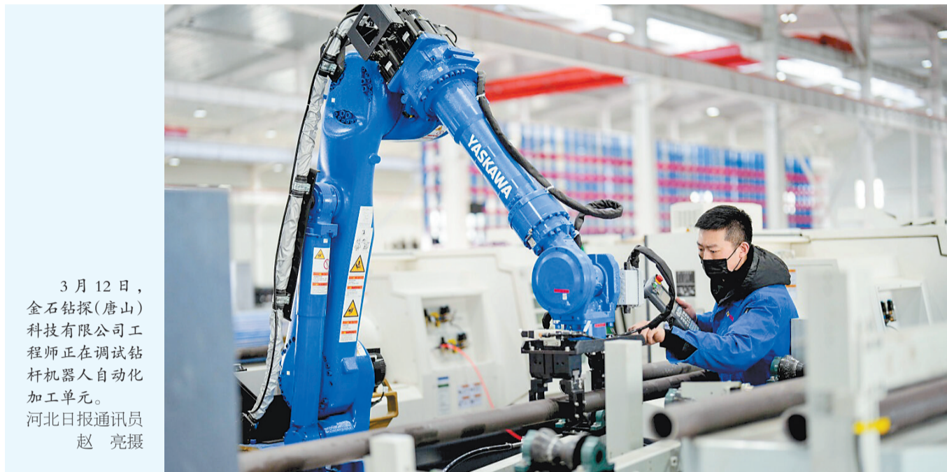
3月12日,金石钻探(唐山)科技有限公司工程师正在调试钻杆机器人自动化加工单元。

产业迅猛发展,“硬核”政策给足底气。去年6月,《加快唐山市高端装备制造产业集群发展工作方案(2023-2027年)》出台,明确提出,坚持“龙头引领、集聚优化”的发展方向,做大做强机器人、智能轨道交通装备两大优势装备制造,做长产业链条,做大产业规模,增强竞争优势,力争行业领军。同