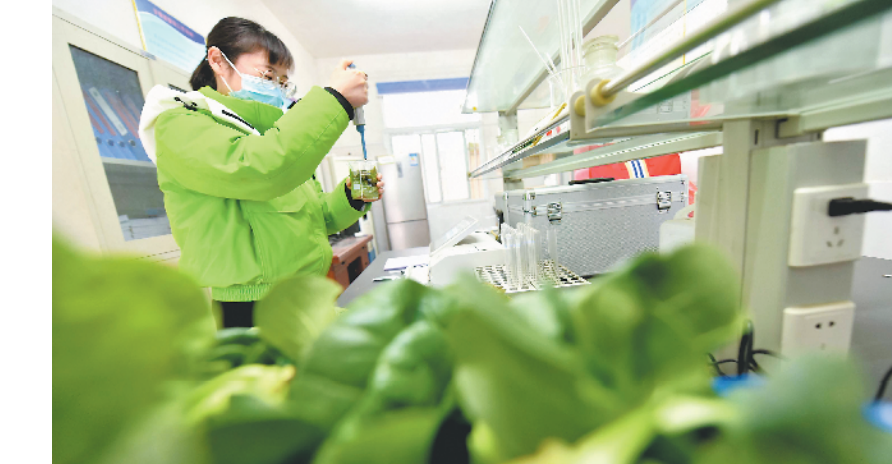
2月21日,合肥市肥东县八斗镇农办工作人员在检验室对蔬菜样本进行农药残留检测。该镇在发展现代农业的同时,从源头确保农产品质量安全。

在该市龙岗抗大八分校举行团校揭牌仪式。团校成立后,将定期组织集中培训,打造精品团课,全面提高广大基层团干部的理论和业务水平,增强团组织的凝聚力和向心力,培养造就一支“有理想、有本领、有担当”的基层团干部队伍。除了选派在校大学生兼任基层团干部,天长市“天聚英才”青春振兴工程还包括线上“团聚英才”一站式青年人才服务平台、线下“双一流”毕业生暑期夏令营、大学生暑期社会实践、“缘来是你”青年交友联谊、“天聚英才”TED沙龙等系列活动,助力该市青年人才引进工程和乡村振兴战略。